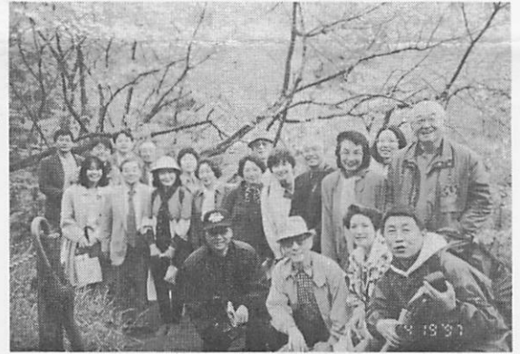
観桜会 多摩桜実験林